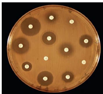
Figura 3: Modelo de halo de inibição formado durante o teste de eficácia do sistema conservante