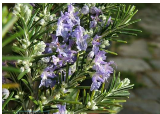
Figura 2: Flores de Rosmarinus officinalis

O alecrim é encontrado em terrenos rochosos e arenosos do litoral de países em volta do Mar Mediterrâneo (Espanha, Itália, Grécia, Norte da África e na Dalmácia, uma região comum à Hungria e à Áustria). No Brasil, é chamada de alecrim-de-cheiro, alecrim comum, alecrim-de-jardim e alecrim-da-horta. Pertencente à família das Labiadas ( Labiatae ), caracterizada pela presença de dois lábios nas suas flores, além de serem as folhas e o caule cobertos por pelos glandulares que produzem o óleo essencial, cuja qualidade do alecrim está diretamente relacionada com a localização (latitude), condições locais de solo, clima, altitude, boa exposição à luz solar, e época de colheita. (MARCHIORI, 2004)