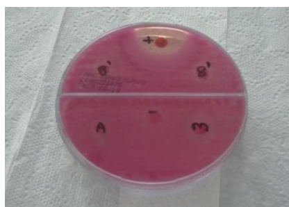
Figura 4: Halo de inibição para Escherichia coli , em meio contendo óleo de alecrim (esquerda - A).

A figura 4 ilustra os halos formados nas análises feitas com o óleo puro, produzindo diâmetro de 14 mm para o óleo de alecrim (A), sinalizando o óleo essencial de alecrim com atividade antibacteriana intermediária, se comparado ao halo formado no controle positivo com clorafenicol (+), de 35 mm.